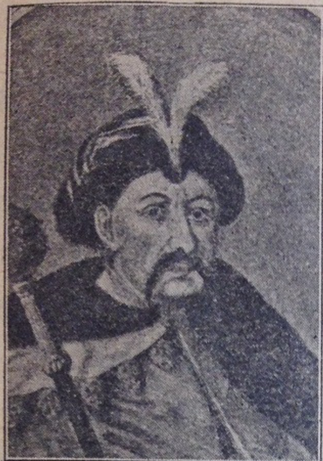
Гетьман Богдан Хмельницький. Умер р. 1654 липня 27-го роз- почавши в союзі з Швецією та Семигородом війну з віроломною Московщиною й Поляками.