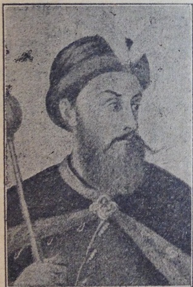
Гетьман Петро Дорошенко. У союзі з Туреччиною воював з Москвинами й був вигнав їх зо- всім з України. Умер у москов- ській неволі р. 1698.