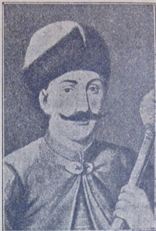
Гетьман Іван Виговський. У союзі з Польщею й Кримським ханом воював з Москвинами, тяж- ко побив їх під Конотопом. Роз- стріляно р. 1664 березня 9-го.